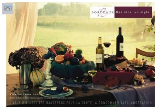
Campagne internationale versus campagne française